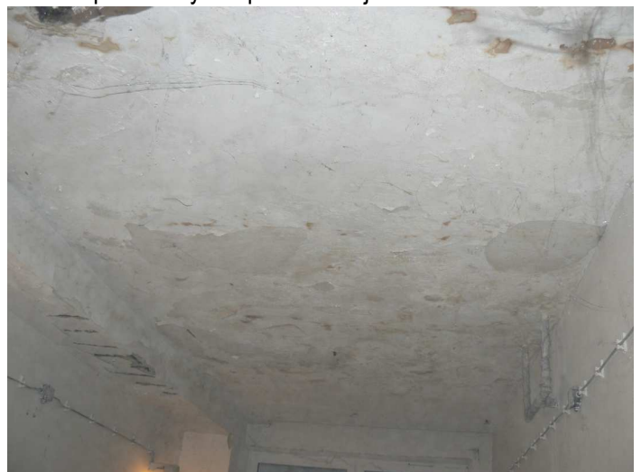
F102 Pohľad na výrazne zatečený strop a stropný prievlak skladu pod kuchyňou, z ktorých opadáva omietka