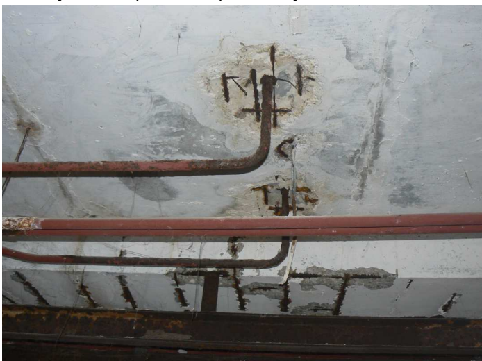
F77 Pohľad na staticky narušené časti stropu a stropného prievlaku skladu pod kuchyňou