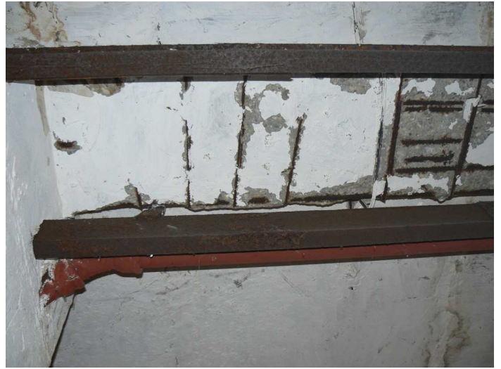
F80 Detail statického narušenia spodnej časti stropného prievlaku skladu pod kuchyňou pri stĺpe