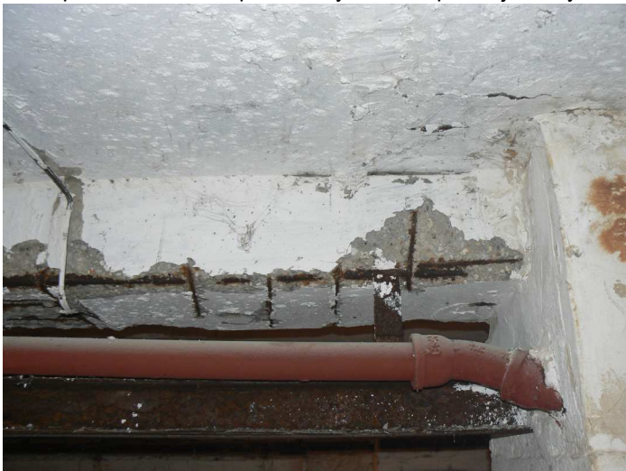
F83 Detail statického narušenia spodnej a bočnej časti stropného prievlaku skladu pod kuchyňou pri stĺpe