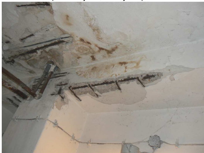
F105 Detail narušenia stropu a stropného prievlaku skladu pod kuchyňou v okolí stĺpa