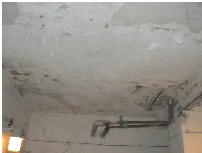
F103 Pohľad na výrazne zatečený strop a stropný prievlak skladu pod kuchyňou, z ktorých opadáva omietka