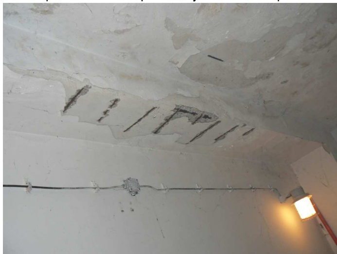
F106 Detail narušenia stropu a spodnej časti stropného prievlaku skladu pod kuchyňou v strede rozpätia