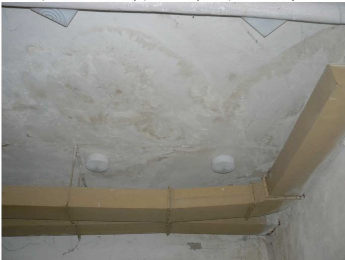
F99 Pohľad na zatečenú časť stropu zadného skladu pod kuchyňou