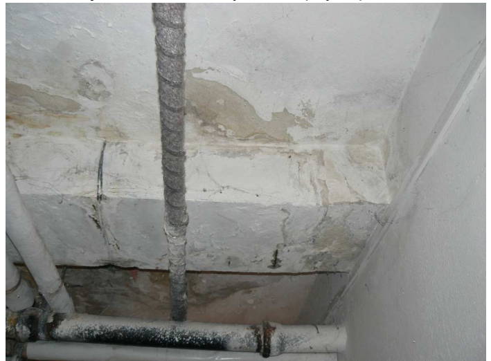
F88 Pohľad na výrazne zatečený strop a stropný prievlak komunikačnej chodby pod kuchyňou