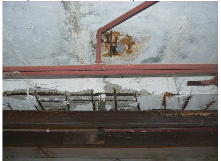
F78 Pohľad na staticky narušené časti stropu a stropného prievlaku skladu pod kuchyňou