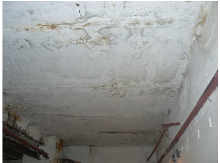
F86 Pohľad na zatečený strop skladu pod kuchyňou najmä v miestach stykov stropných prefabrikátov