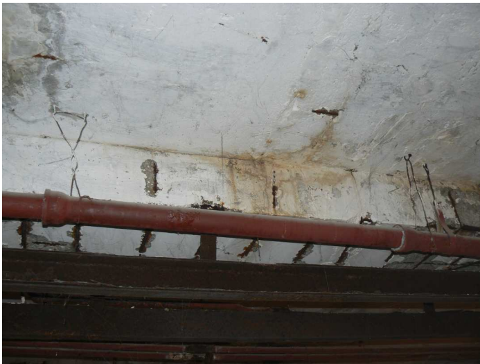
F85 Detail statického narušenia spodnej a bočnej časti stropného prievlaku skladu pod kuchyňou v strede