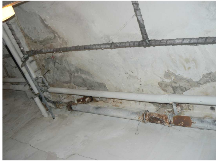
F92 Detail výrazného zatečenia stropu chodby pod kuchyňou v okolí inšalačných prestupov