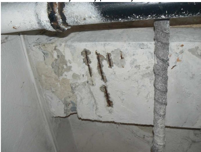
F89 Detail zatečenia a mierneho narušenia spodnej časti stropného prievlaku chodby pod kuchyňou