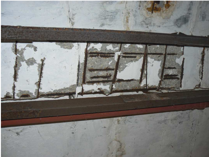
F81 Detail statického narušenia strednej časti stropného prievlaku skladu pod kuchyňou zo spodnej strany