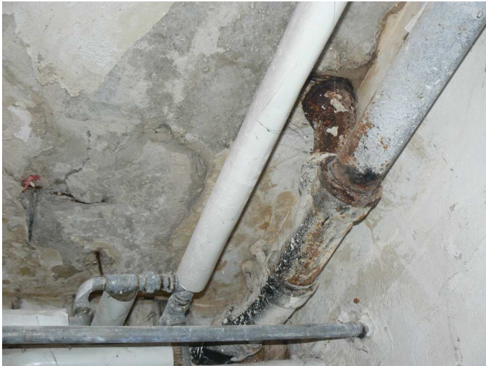
F93 Detail výrazného zatečenia stropu chodby pod kuchyňou v okolí inšalačných prestupov