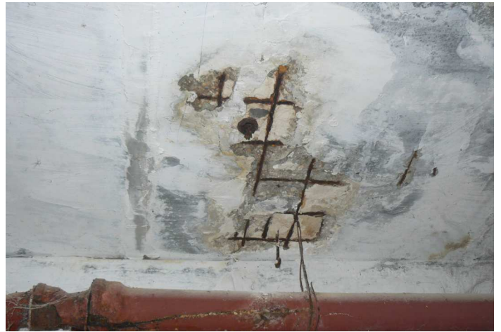
F74 Detailný pohľad na obnaženú a výrazne prehrdzavenú výstuž stropu skladu pod kuchyňou