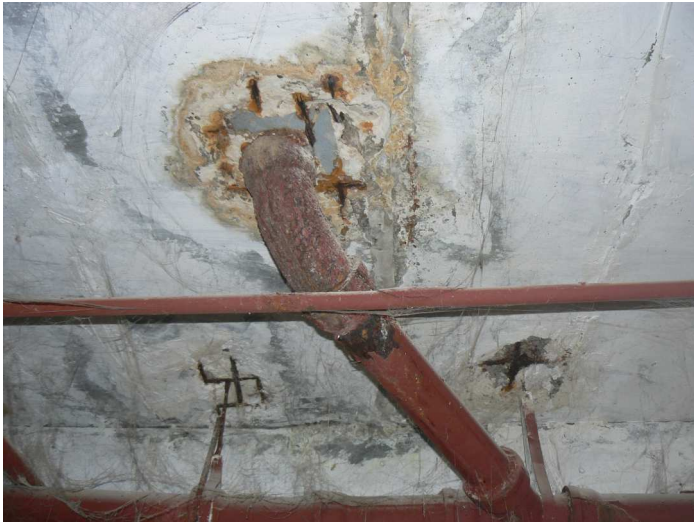
F75 Detailný pohľad na obnaženú a výrazne prehrdzavenú výstuž stropu skladu pod kuchyňou