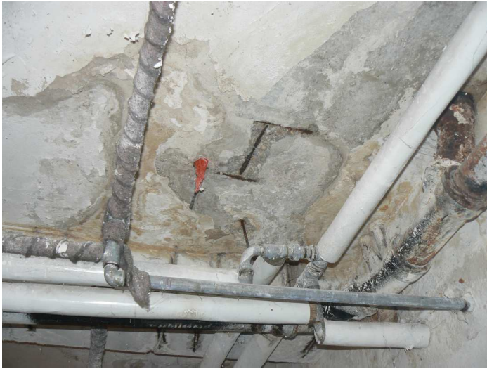
F91 Detail výrazného zatečenia stropu a stropného prievlaku komunikačnej chodby pod kuchyňou