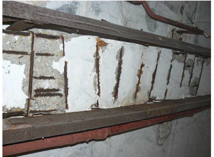
F82 Detail statického narušenia strednej časti stropného prievlaku skladu pod kuchyňou zo spodnej strany