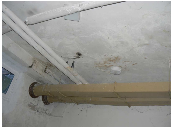
F100 Pohľad na zatečenú časť stropu zadného skladu pod kuchyňou pri fasádnej stene