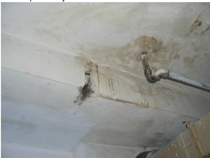
F101 Detail zatečeného stropu a stropného prievlaku zadného skladu pod kuchyňou pri fasádnej stene