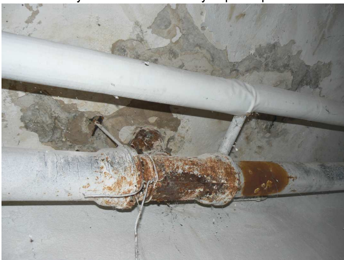
F95 Detail výrazného zatečenia stropu chodby pod kuchyňou v okolí inšalačných prestupov