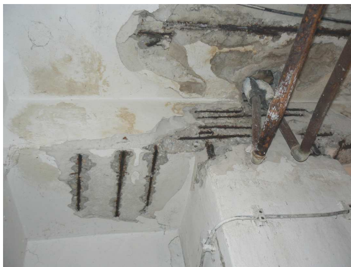
F104 Detail narušenia spodnej a bočnej časti stropného prievlaku skladu pod kuchyňou v okolí stĺpa