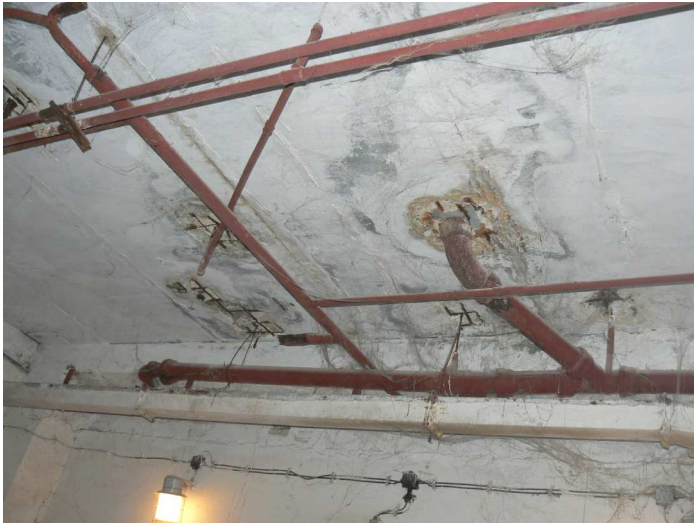
F73 Pohľad na zatečený a staticky narušený strop skladu pod kuchyňou