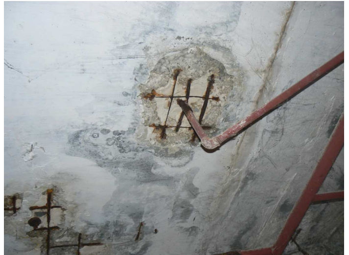
F76 Detailný pohľad na obnaženú a výrazne prehrdzavenú výstuž stropu skladu pod kuchyňou