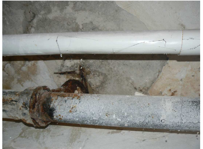
F94 Detail výrazného zatečenia stropu chodby pod kuchyňou v okolí inšalačných prestupov