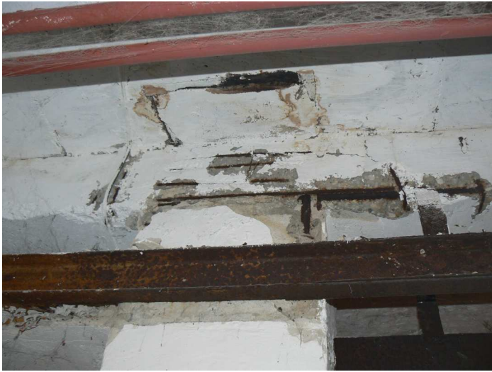
F79 Detail statického narušenia stropného prievlaku skladu pod kuchyňou v jeho uložení na stĺp