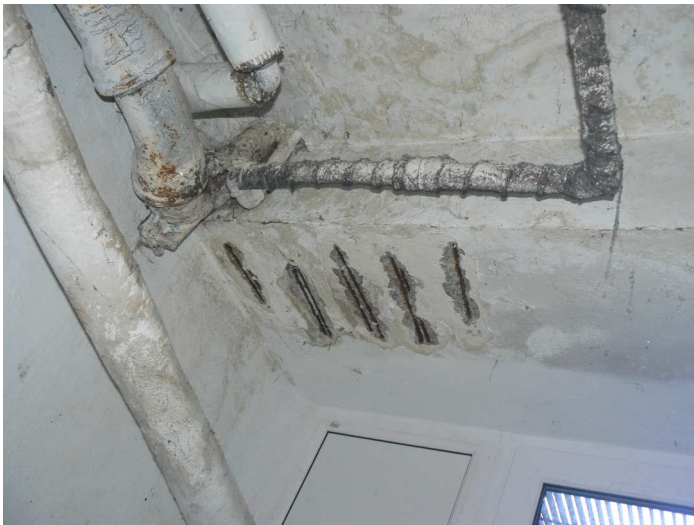
F97 Detail statického narušenia spodnej časti stropného prievlaku chodby pod kuchyňou pri fasádnej stene