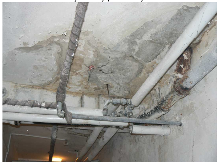
F90 Detail výrazného zatečenia stropu a stropného prievlaku komunikačnej chodby pod kuchyňou