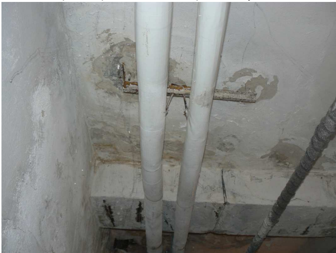
F87 Pohľad na výrazne zatečený strop a stropný prievlak komunikačnej chodby pod kuchyňou