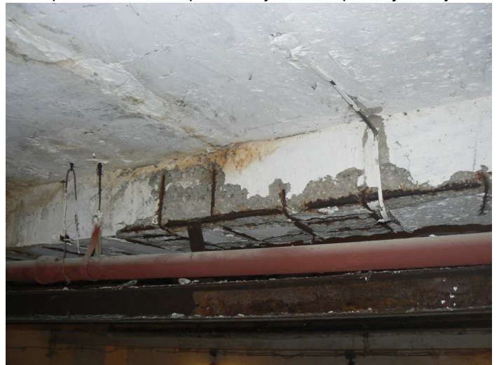
F84 Detail statického narušenia spodnej a bočnej časti stropného prievlaku skladu pod kuchyňou v strede